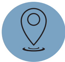
Lokal & Saisonal